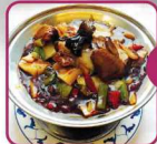
G6 Schweinefleisch, zweimal gebraten (scharf) 16 € 6,50