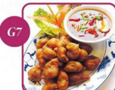
€ 6,50 Schweinefleisch kross nach "Szechuan Art" (scharf)