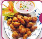
G4 Schweinefleisch kross, süß-sauer 5 € 6,50