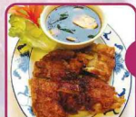
B Geröstete Ente mit Bambus und Champignons 16 € 8,00

€ 7,50 Dreierlei Fleisch mit Bambus und Porree 16