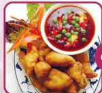
G13 Knuspriger Fisch 7 nach "Szechuan Art" (scharf) 16f € 6,50