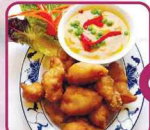
G14 Knuspriger Fisch 7 mit Curry € 6,50 (scharf) 15f