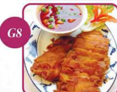
€ 6,50 Hühnerbrust, gebacken mit Ananas (süß-sauer) 5