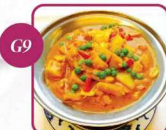
€ 6,50 Hühnerbrust Curry (scharf) 15