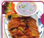
A Geröstete Ente mit Ananas in einer süß-sauren Sauce 5 € 8,00

€ 8,00 Geröstete Ente nach "General Tso's Art" mit frischem Gemüse in einer scharfen süß-sauren Sauce 16