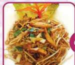
G15 Gebratene Nudeln mit Hühnerfleisch 16 € 6,50