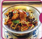
G5 Schweinefleisch Chop-Suey 16 € 6,50