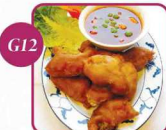
€ 6,50 Knuspriger Fisch 7 , süß-sauer 5f