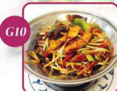
€ 6,50 Hühnerbrust Chop-Suey 16