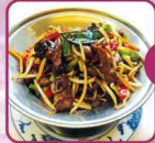
G2 Rindfleisch mit Chop-Suey 16 € 6,50