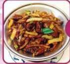
G3 Rindfleisch, haschiert mit Zwiebeln 16 € 6,50